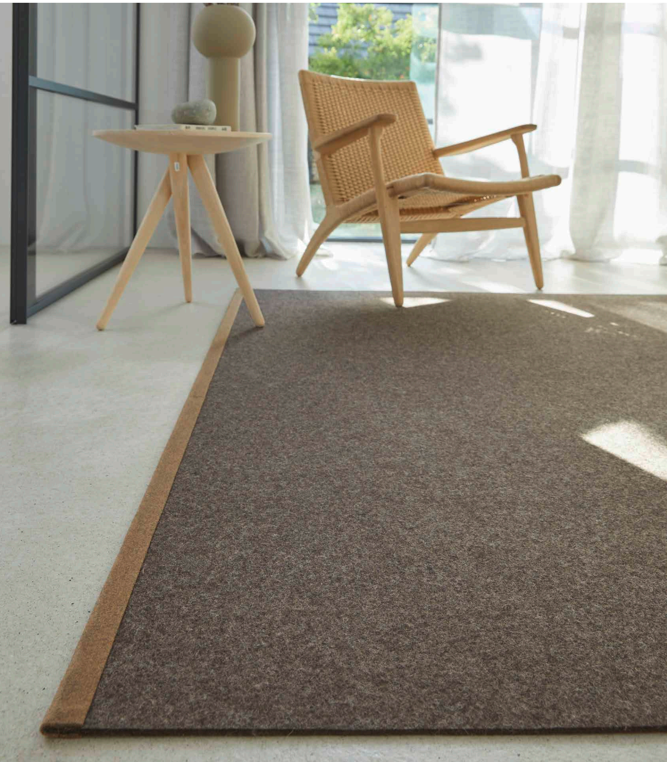
Clip Three 7612/995 Felt 3752/123 Textil 9114/020 180 x 300 cm