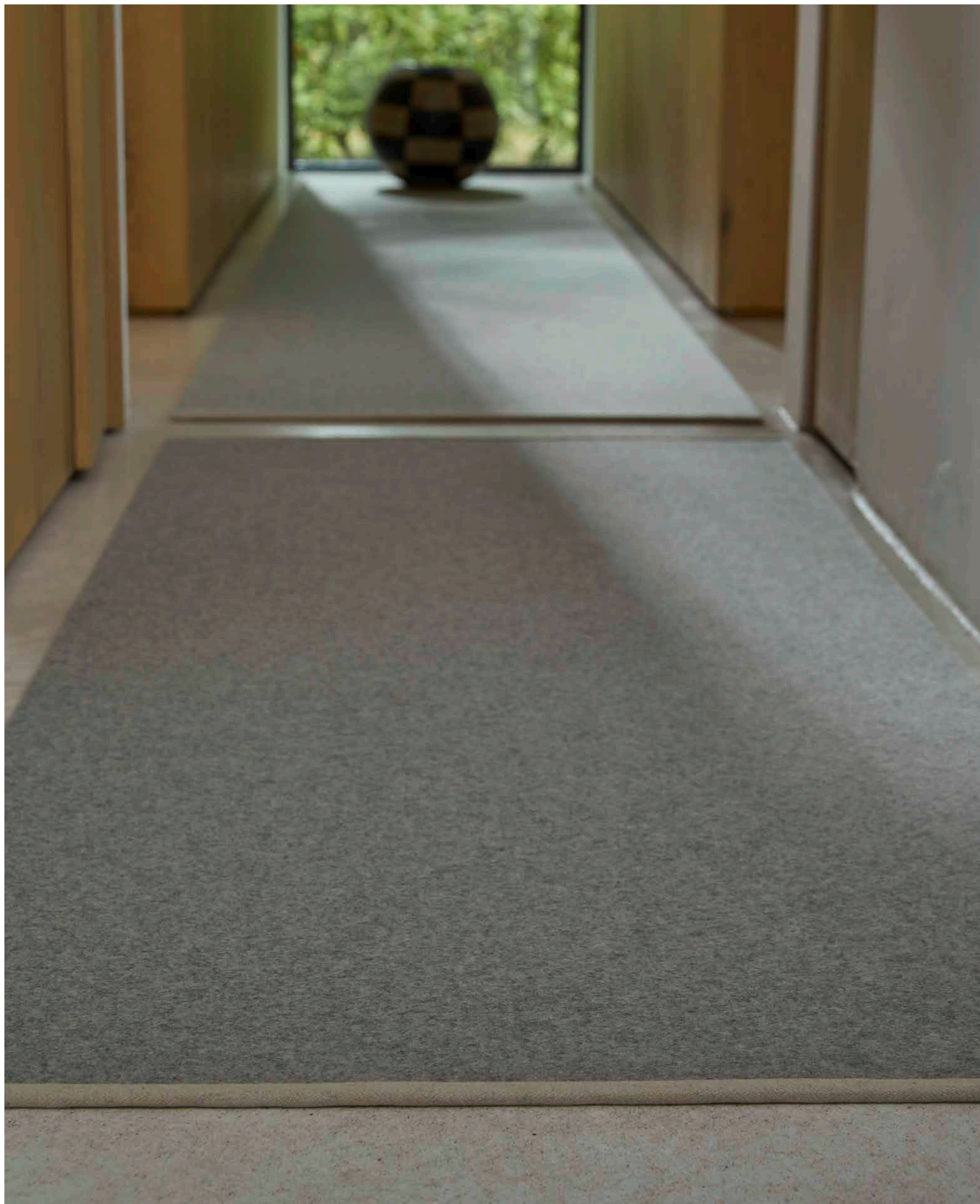
Clip One 7613/993 Felt 3752/097 Textil 9114/074 75 x 400 cm 75 x 180 cm