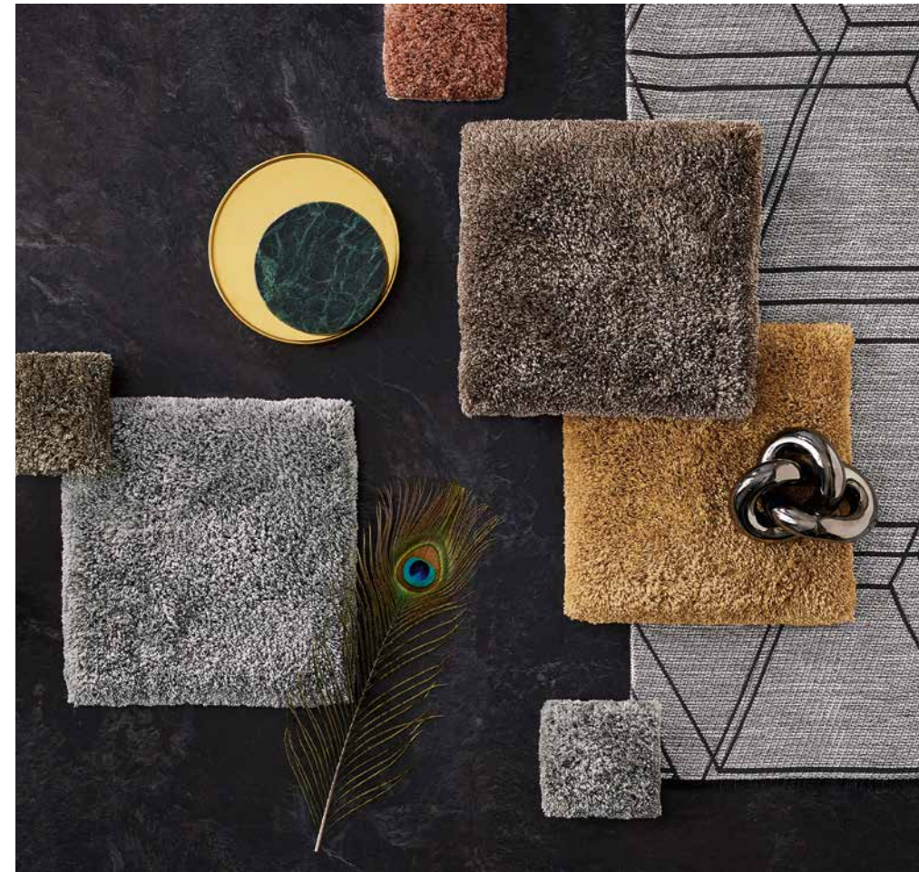
spirit 7604/ (ohne Fransen / without fringes) 7604F/ (mit Fransen / with fringes) Nutzschicht / Surface 100% TENCEL™ Lyocell

The high-pile structure lends spirit a casual, relaxed aura. This is enhanced by the naturally warm colour spectrum including 15 shades.