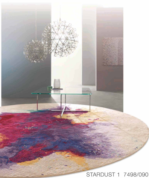
STARDUST 1 7498/090

STARDUST7498はカラーパウダーをかけ合っって祝うヒンドゥー教の「ホーリー祭」からインスパイアされて誕生しました。