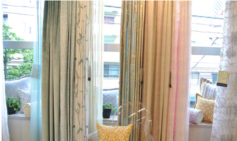
○クッション Indoor/Outdoor シリーズ MARBELLA (JAB) ¥11,200 ~ ¥29,500/m

撥水加工や防カビ加工、日焼けに強い生地でお作りしたクッションなどもディスプレイしておりますで、インテリアからアウトドアまで、幅広いご提案にご活用いただけます。