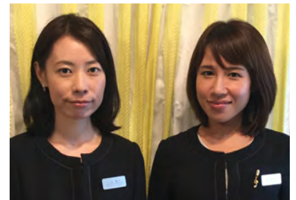
私たちが自信と誇りを持って担当しています！