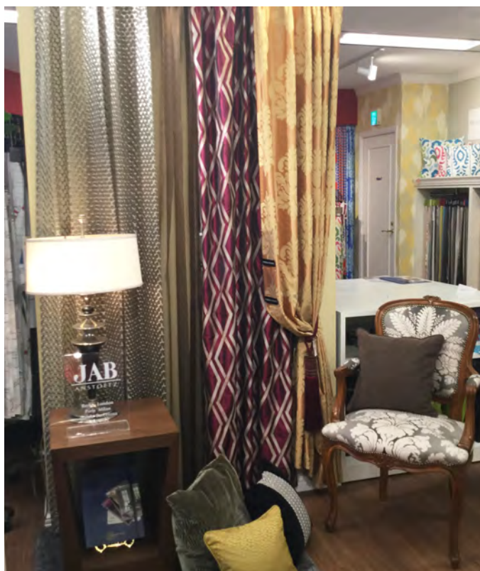
○左レース：BO 9-7431-091 14,400円/m 132cm巾 ○中央レース：HARLEM RIVER 9-7677-060 10,200円/m 300cm巾 ○紫ドレープ：CHARDONNE WE7198-080 29,400円/m 126cm巾 ○オレンジドレープ：ADORATA 9-7704-060 35,600円/m 295cm巾 ○椅子：STANCLIFFE-CHARCOAL 63374-01 23,100円/m 134cm巾

このスペースでは、数多くの組み合わせをご提案しております。住まいのちょっとしたコーナーに無限の世界感を広げることができることを知っていただきたく、ご提案しております。