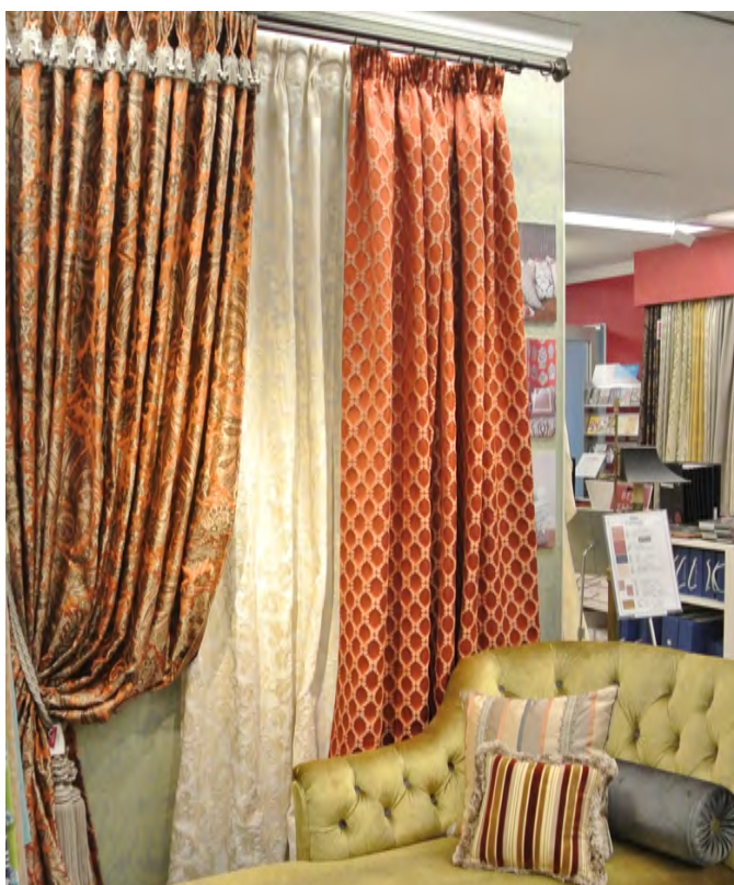
○左カーテン：CALVERT PAISLEY-SIENNA 53580-01 32,800円/m 137cm巾 ○右カーテン：GLYN-POTTERY 53617-08 25,000円/m 132cm巾 ○左右カーテンの裏地：LANCE 1-6768-051 9,300円/m 140cm巾 ○中央のレース：THIRA-PLATINUM 56527-02 34,200円/m 132cm巾 ○手前のカウチ張地：PISTOIA VELVET CA1292/040 14,600円/m 150cm巾

こちらでは生地をさまざまな縫製方法でカーテンに仕上げ、ディスプレイすることで、平面だけではお伝えしきれない魅力をお伝えしています。特にクラシックな模様の生地は、ドレープやヒダの取り方によって出てくる陰影、生地の重みによる落ち感など、縫製によって表情が大きく変わります。そのため、ここでは山の仕上げをギャザーにしたり、高さを変えたりすることなど、縫製のアイデアもご提案しています。