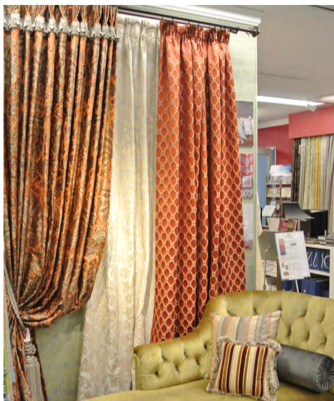
○左カーテン：CALVERT PAISLEY-SIENNA 53580-01 32,800円/m 137cm巾 ○右カーテン：GLYN-POTTERY 53617-08 25,000円/m 132cm巾 ○左右カーテンの裏地：LANCE 1-6768-051 9,300円/m 140cm巾 ○中央のレース：THIRA-PLATINUM 56527-02 34,200円/m 132cm巾 ○手前のカウチ張地：PISTOIA VELVET CA1292/040 14,600円/m 150cm巾

こちらでは生地をさまざまな縫製方法でカーテンに仕上げ、ディスプレイすることで、平面だけではお伝えしきれない魅力をお伝えしています。特にクラシックな模様の生地は、ドレープやヒダの取り方によって出てくる陰影、生地の重みによる落ち感など、縫製によって表情が大きく変わります。そのため、ここでは山の仕上げをギャザーにしたり、高さを変えたりすることなど、縫製のアイデアもご提案しています。